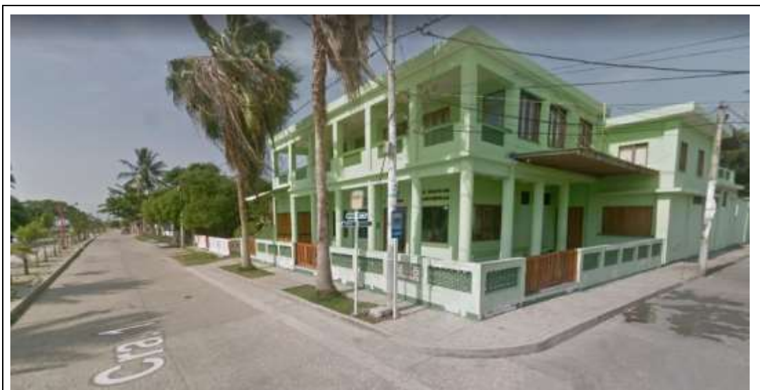
Fotografía 1. Ubicación de la Escuela De Gastronomía Y Turismo Del Golfo Del Morrosquillo.

El lugar donde se ejecutará el contrato será en LA ESCUELA DE GASTRONOMÍA Y TURISMO DEL GOLFO DEL MORROSQUILLO, UBICADA EN EL MUNICIPIO DE TOLÚ, DEPARTAMENTO DE SUCRE , ubicada en la dirección Carrera 1 o Avenida la Playa No. 20-10, predio bajo título del SENA con Escritura Pública No. 320 de 31 de agosto de 2005 registrada en la Notaría Única del Circulo Notarial de Tolú y en los predios de las direcciones Carrera 1 No. 20-26 y Carrera 2 No. 20-41 LOTE 005 - MANZ 015, predios bajo título del SENA, identificados respectivamente mediante Certificado de Tradición y Libertad con matricula No. 340-7114 de 20 de octubre de 2020, según Escritura Pública No. 231 de 8 de octubre de 2020 registrada en la Notaría Única del Circulo Notarial de Tolú y Certificado de Tradición y Libertad con matricula No. 340-98091 de 24 de julio de 2020, según Escritura Pública No. 145 de 14 de julio de 2020 registrada en la Notaría Única del Circulo Notarial de Tolú.