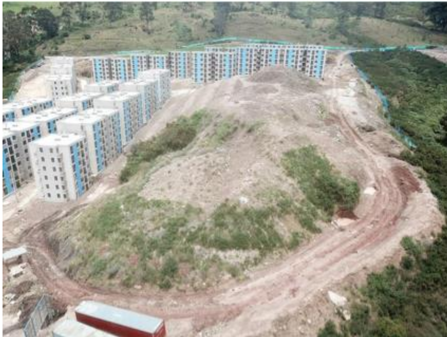
Figura 2. Vista aérea del predio