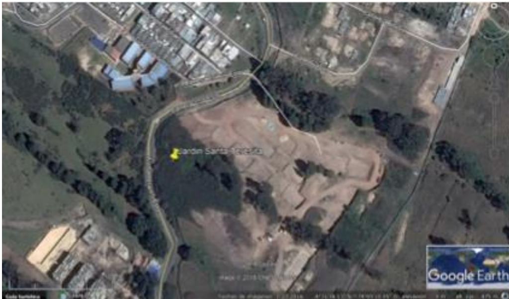
Figura 1. Ubicación general del inmueble, vías de acceso y elementos de referencia