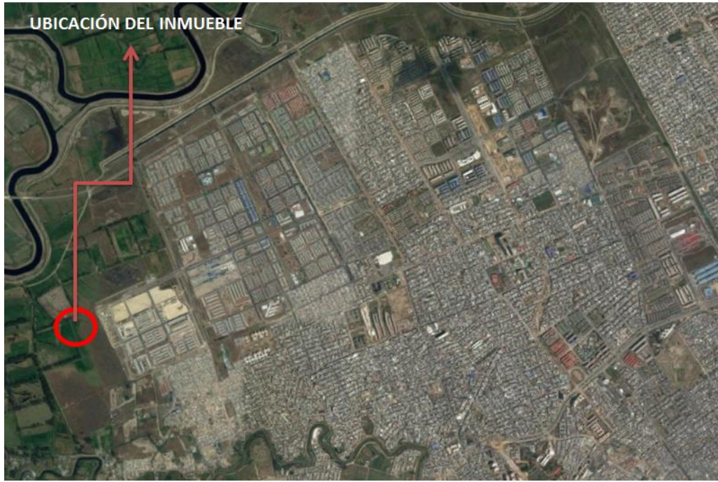
Ubicación del inmueble – UPZ 87 – Tintal Sur,