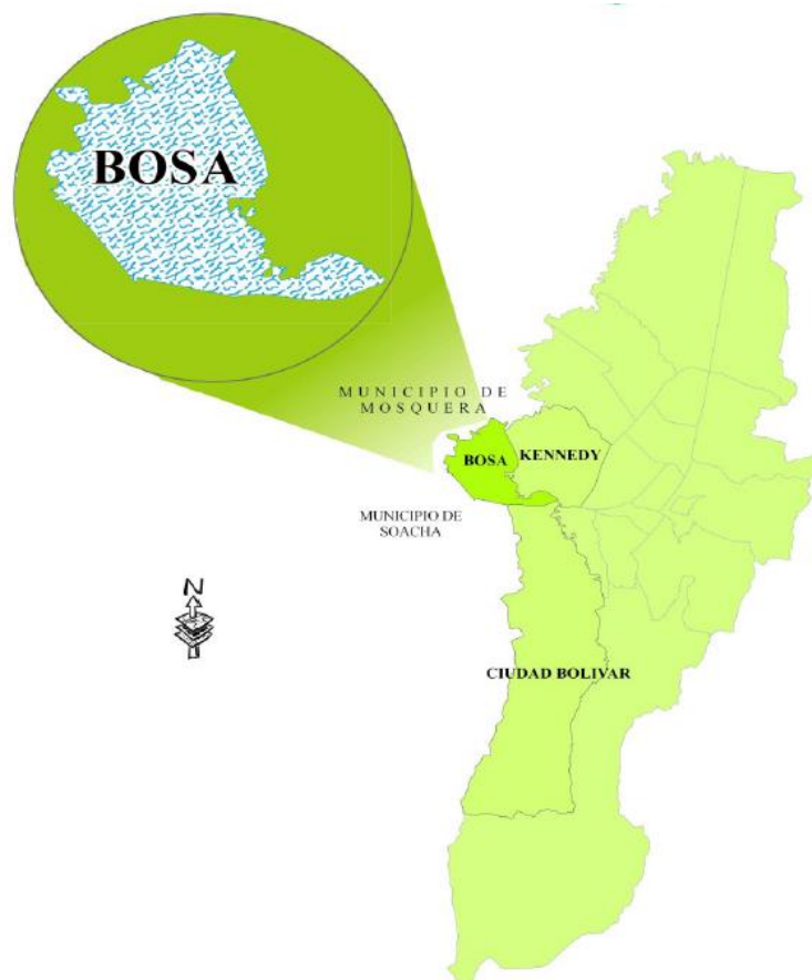
Figura 1 – Ubicación de la localidad de Bosa en la ciudad de Bogotá.

El área metropolitana de Bogotá es una conurbación colombiana no oficialmente constituida, por lo que su extensión exacta varía de acuerdo a la interpretación. De acuerdo con el Departamento Administrativo Nacional de Estadística (DANE), esta conurbación está compuesta por: Bogotá como su centro y (en orden alfabético) por los municipios de Bojacá, Cajicá, Chía, Cogua, Cota, El Rosal, La Punta Facatativá, Funza, Gachancipá, La Calera, Madrid, Mosquera, Nemocón, Soacha, Sibaté, Sopó, Subachoque, Tabio, Tenjo, Tocancipá y Zipaquirá. (Fuente: http://www.bogota.gov.co/ , consultado en Febrero 5 de 2018).