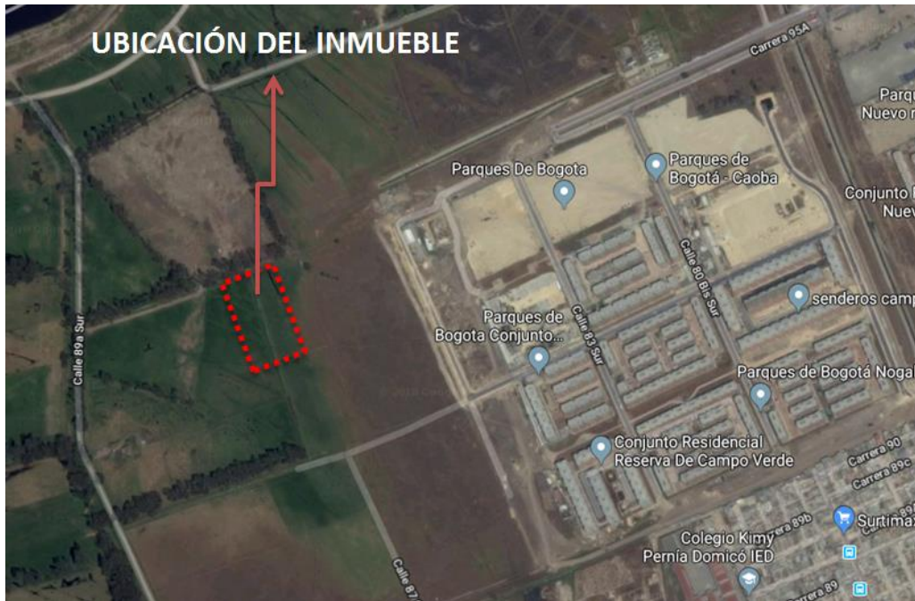
Figura 2. Ubicación general del inmueble, vías de acceso y elementos de referencia