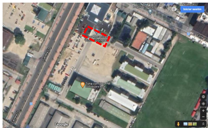
Fotografía 3. Localización Detallada del Nuevo Edificio del Comando de la Brigada XIII del Ejército.