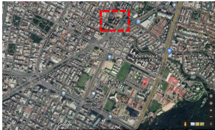
Fotografía 2. Localización General del Proyecto en la ciudad de Bogotá D.C.