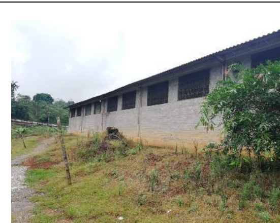
Fotografía 3. Área de intervención