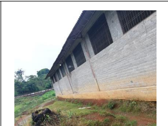
Fotografía 4. Área de intervención