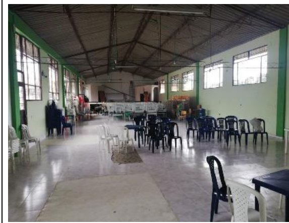
Fotografía 5. Interior Aula múltiple