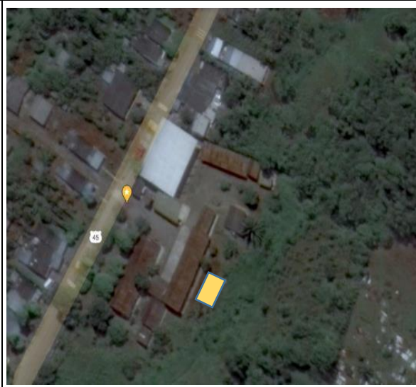
Fotografía 2. Área de intervención