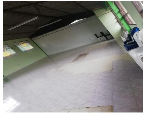
Fotografía 6. Interior Aula Múltiple