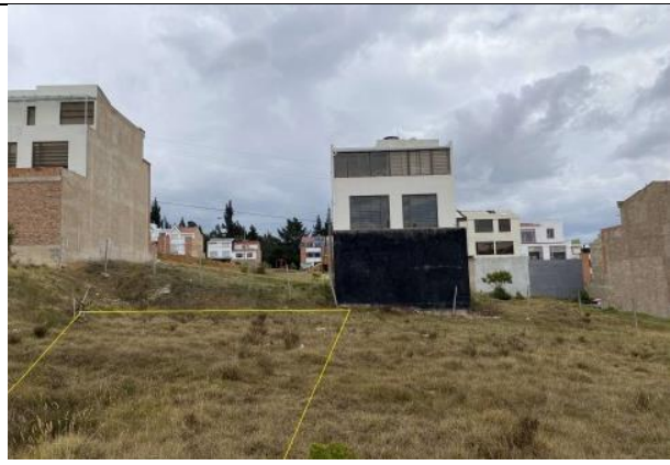
Fotografía 2. Vista actual del predio