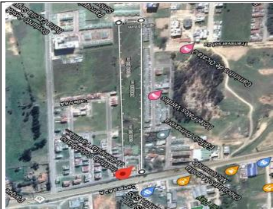
Fotografía 1. Localización proyecto