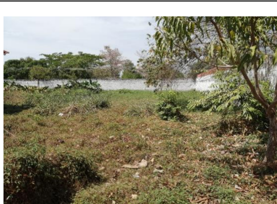
Fotografía 2. Vista actual del predio