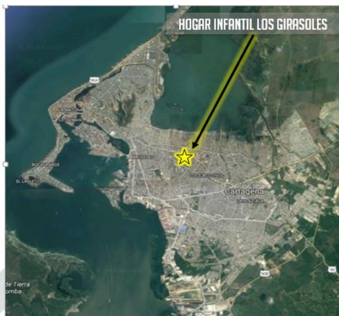
Localización Foto predio para Hogar Infantil Girasoles, Cartagena - Bolivar

Ubicación del Lote: El lote en el cual se desarrollará el proyecto corresponde al predio con matrícula inmobiliaria N 060-20284 de la oficina de registros públicos del municipio de Cartagena Departamento de Bolivar, con área de 357 m2 propiedad del Instituto Colombiano de Bienestar Familiar.