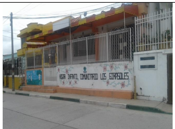
Fotografía 2. Edificación a demoler para desarrollar el proyecto.