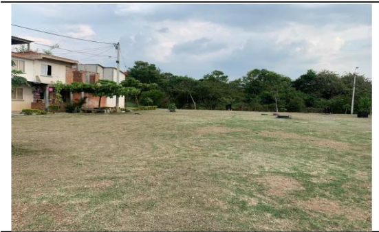
FOTO FRONTAL PREDIO