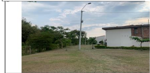
VISTA GENERAL DEL PREDIO