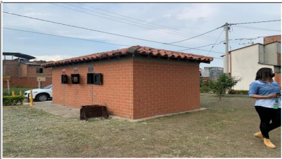
VISTA SHUT DE BASURA QUE SE ENCUENTRA EN EL PREDIO