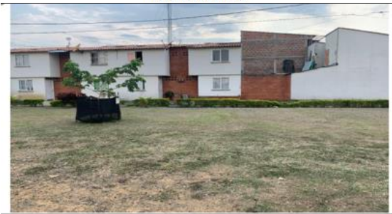
VISTA GENERAL DEL PREDIO