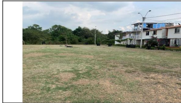
FOTO FRONTAL PREDIO