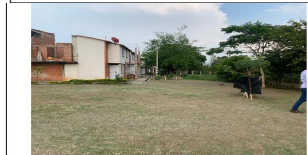
VISTA GENERAL DEL PREDIO