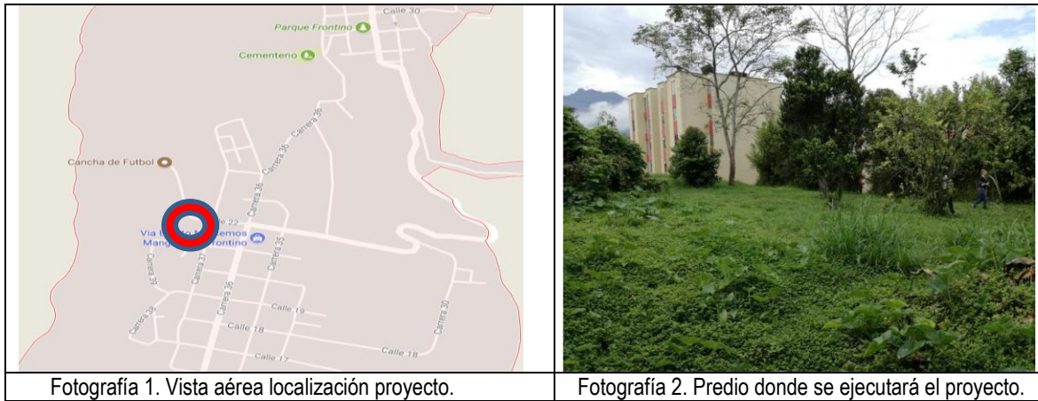
Fotografía 1. Vista aérea localización proyecto.