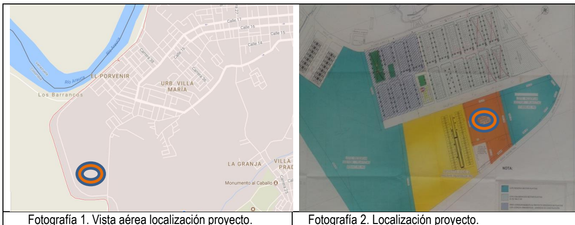
Fotografía 1. Vista aérea localización proyecto.