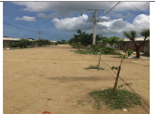
Fotografía 2. Predio donde se ejecutará el proyecto.