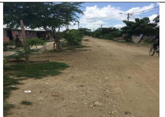
Fotografía 4. Predio donde se ejecutará el proyecto.

Ubicación del Lote: El lote en el cual se desarrollará el proyecto corresponde al predio con matrícula inmobiliaria No. 060-275064, 060-279477, 060-280184, 060-280191, 060-280179, 060-280177, 060-279478, 060-280174, 060-280168, 060-280161 y 060-279014, de propiedad de la alcaldía del Distrito Turístico y Cultural de Cartagena, con un área aproximada de 5.669,7 m 2 .