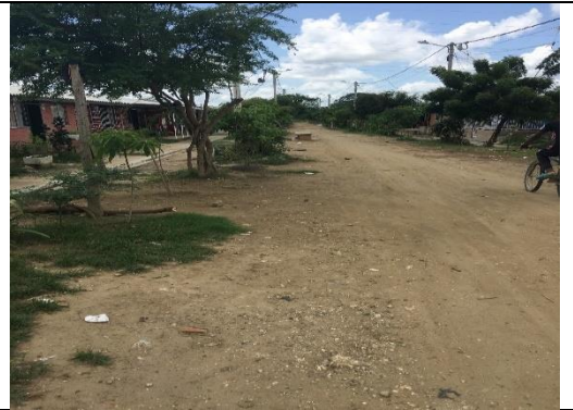
Fotografía 4. Predio donde se ejecutará el proyecto.

Ubicación del Lote: El lote en el cual se desarrollará el proyecto corresponde al predio con matrícula inmobiliaria No. 060-275064, 060-279477, 060-280184, 060-280191, 060-280179, 060-280177, 060-279478, 060-280174, 060-280168, 060-280161 y 060-279014, de propiedad de la alcaldía del Distrito Turístico y Cultural de Cartagena, con un área aproximada de 5.669,7 m 2 .