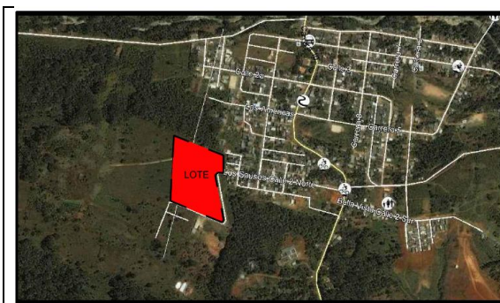
Fotografía 1. Vista aérea localización proyecto.

La ejecución de la infraestructura objeto de la presente convocatoria se llevará a cabo en el lote identificado bajo la Matrícula Inmobiliaria No. 440-72597 de la Oficina de instrumentos Públicos de Mocoa, con área de 2.999,05 m 2 propiedad del municipio de Mocoa