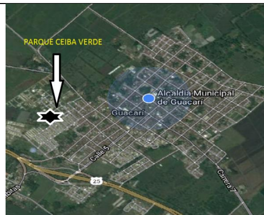
Fotografía 2. Vista aérea localización proyecto.

Ubicación del Lote: El lote en el cual se desarrollará el proyecto corresponde al predio con matrícula inmobiliaria No. 378 – 78567, de propiedad de la alcaldía Municipal de Guacarí, con un área aproximada de 5.192 m2.