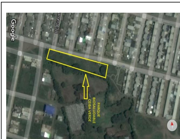
Fotografía 1. Predio donde se ejecutará el proyecto.

La ejecución de la infraestructura objeto de la presente convocatoria se llevará a cabo en el lote identificado bajo la Matrícula Inmobiliaria No. 378 – 78567 de la Oficina de instrumentos Públicos de Guacarí, con área de 5.192 m2, propiedad del municipio de Guacarí.