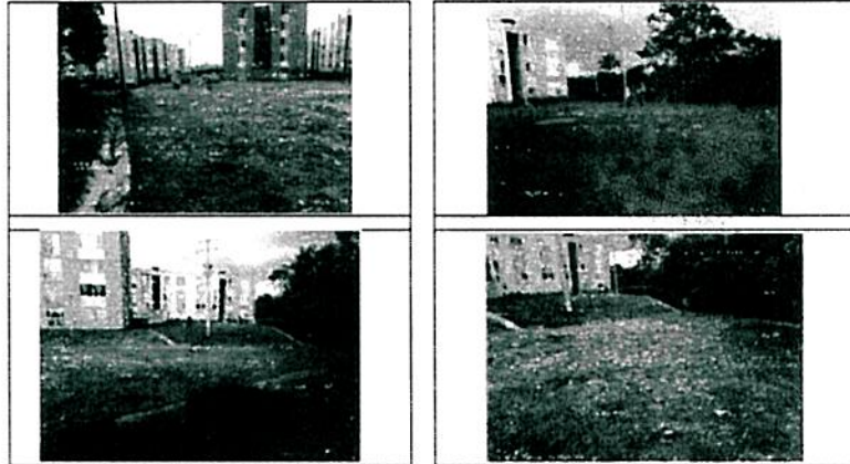
Fotografía 1. localización proyecto Urbanización Parque de las Garzas – Popayán