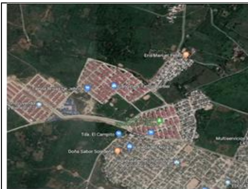
Fotografía 1. Localización proyecto Nueva Esperanza etapa2

La ejecución de la infraestructura objeto de la presente convocatoria se llevará a cabo en el lote identificado bajo la Matrícula Inmobiliaria No 041-154878 de la Oficina de instrumentos Públicos de Soledad, cuya área total es de 4243,95 m 2 aproximadamente propiedad del municipio de Soledad. Del área total del lote disponible solo se intervendrá un área de 3.490 m 2 .