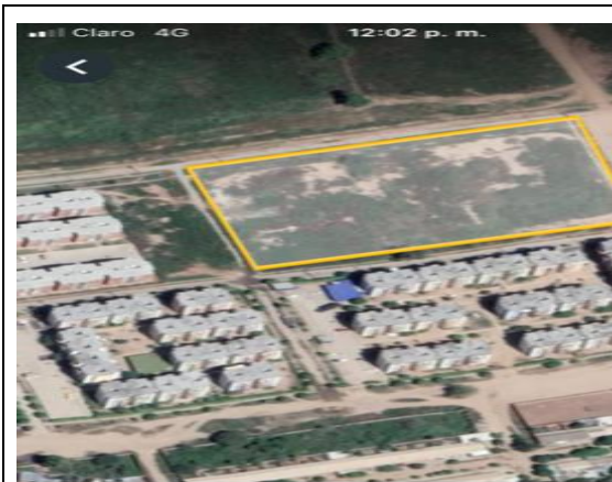
Fotografía 1. Localización proyecto.

La ejecución de la infraestructura objeto de la presente convocatoria se llevará a cabo en el lote identificado bajo la Matrícula Inmobiliaria No. 190-158471 de la Oficina de instrumentos Públicos de Valledupar, con área total de 4.983,38m2 aproximadamente, propiedad del municipio de Fundación. Del área total del lote disponible solo se intervendrá un área de 3.240m2