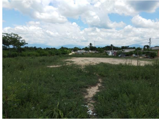
Fotografía 2. Vista general del predio

Ubicación del Lote: El lote en el cual se desarrollará el proyecto corresponde al predio con matrícula Inmobiliaria No. 225-19840 de la Oficina de instrumentos Públicos de Fundación, con área total de 2.560,15m2 aproximadamente, propiedad del municipio de Fundación.