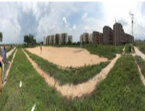
Fotografía 2. Vista general del predio