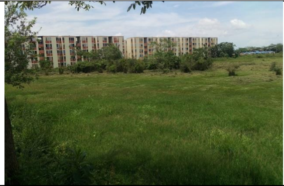
Fotografía 4. Predio donde se ejecutará el proyecto.

Ubicación del Lote: El lote en el cual se desarrollará el proyecto corresponde al predio con Matricula Inmobiliaria No. 410-80361, de propiedad del municipio de Arauca, con un área aproximada de 15.902,53 m 2 .