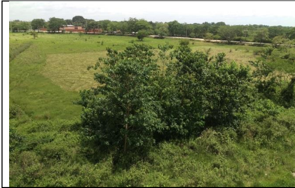
Fotografía 3. Predio donde se ejecutará el proyecto.