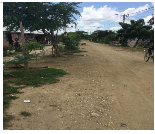
Fotografía 4. Predio donde se ejecutará el proyecto.