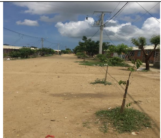
Fotografía 2. Predio donde se ejecutará el proyecto.