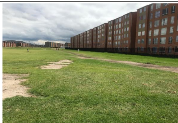
Fotografía 2. ubicación del predio en el macroproyectos, urbanización Ciudad Verde

Ubicación del Lote: El lote en el cual se desarrollará el proyecto corresponde al predio con matrícula inmobiliaria No. 50S-40636028 de la Oficina de instrumentos Públicos de Soacha, cuya área total es de 10.007,29m 2 , propiedad del municipio de Soacha.