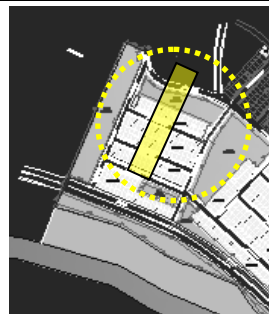
Fotografía 2. ubicación del predio en el macroproyectos, urbanización La Gloria IV Etapa

Ubicación del Lote: El lote en el cual se desarrollará el proyecto corresponde al predio con matrícula Inmobiliaria No. 420-119051 de la Oficina de instrumentos Públicos de Florencia, con área total de 5.799,57m 2 aproximadamente, propiedad del municipio de Florencia.