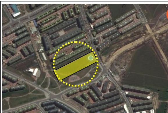
Fotografía 1. Localización proyecto.

La ejecución de la infraestructura objeto de la presente convocatoria se llevará a cabo en el lote identificado bajo la Matrícula Inmobiliaria No 50S-40636028 de la Oficina de instrumentos Públicos de Soacha, cuya área total es de 10.007,29m 2 , propiedad del municipio de Soacha. Del área total del lote disponible solo se intervendrá un área de 2.394m 2 .