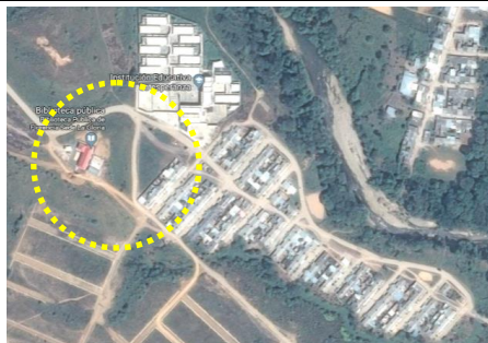
Fotografía 1. Localización proyecto.