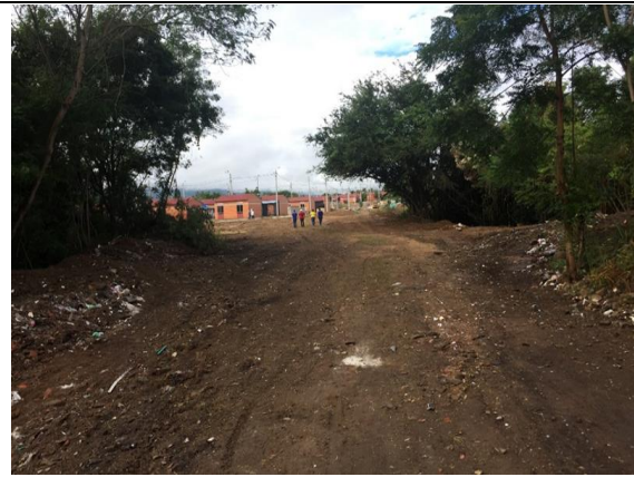
Fotografía 2. Vista general del predio urbanización Villa Diana Carolina III.

Ubicación del Lote: El lote en el cual se desarrollará el proyecto corresponde al predio con matrícula Inmobiliaria No. 307-88540 de la Oficina de Instrumentos Públicos de Girardot, con área total de 10.275m 2 aproximadamente, propiedad del municipio de Ricaurte.