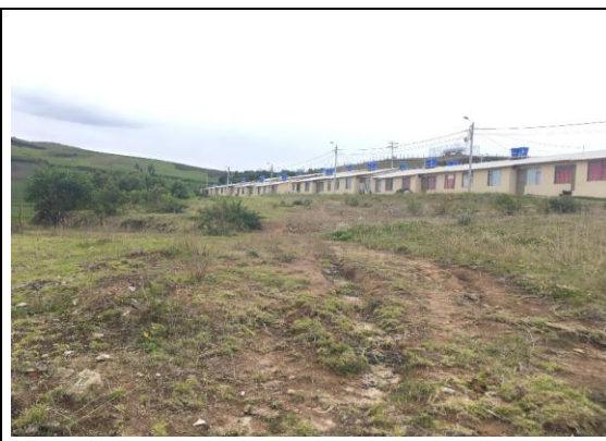
Fotografía 2. Vista del predio

Ubicación del Lote: El lote en el cual se desarrollará el proyecto corresponde al predio con matricula Inmobiliaria No.