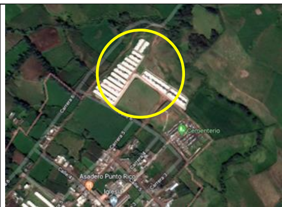
Fotografía 1. Localización proyecto.

La ejecución de la infraestructura objeto de la presente convocatoria se llevará a cabo en el lote identificado bajo la Matricula Inmobiliaria No. 254-47231 de la Oficina de instrumentos Públicos de Ospina, con área total de 1.527 m 2 , aproximadamente, propiedad del municipio de Ospina. Del área total del lote disponible se intervendrá un área de 1.527 m 2 .