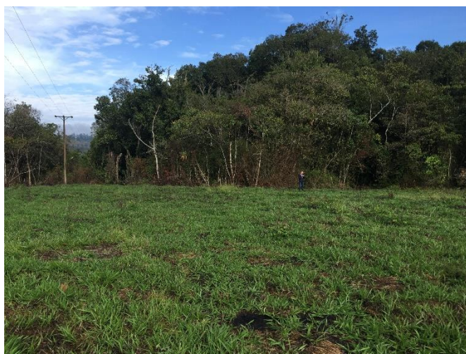
Figura 2 Localización de predio para Colegio y Centro de Desarrollo Infantil (CDI)