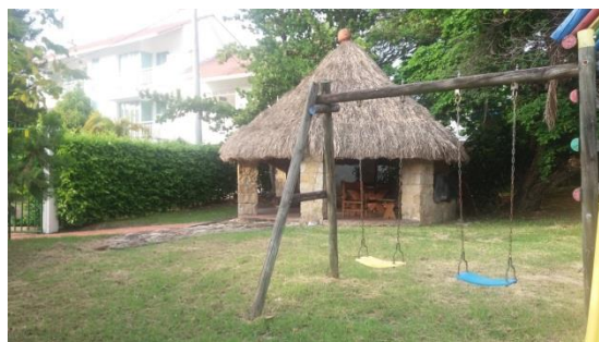
Imagen 2. Predio del proyecto