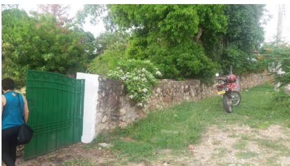
Imagen 1. Vista frontal del lote