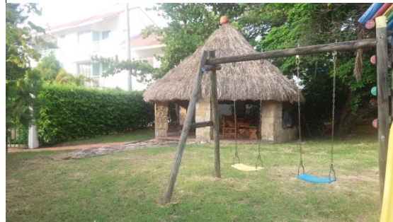
Imagen 2. Predio del proyecto