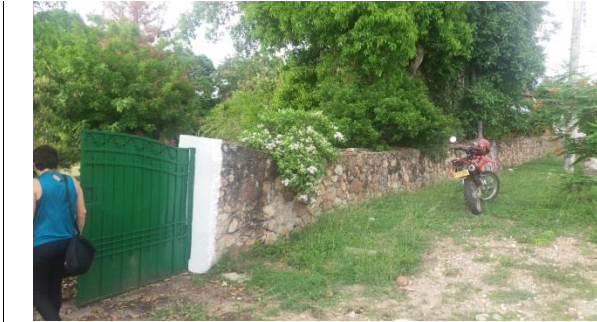
Imagen 1. Vista frontal del lote