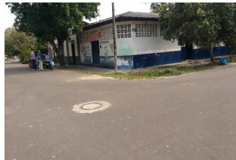
Imagen 2. Vista del predio