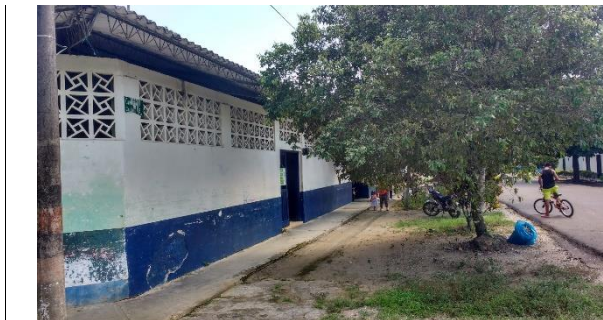
Imagen 1. Vista del predio