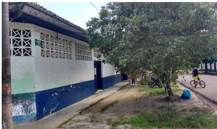
Imagen 3. Vista del predio