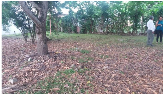
Imagen 3. Predio del proyecto