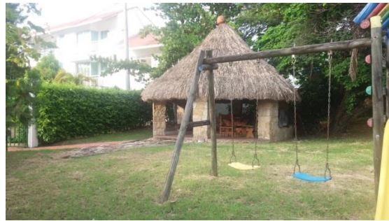
Imagen 2. Entrada al predio del proyecto