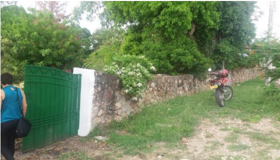
Imagen 1. Vista frontal del lote

El lote en el cual se desarrollará el proyecto corresponde al predio con matrícula inmobiliaria N° 166-93064 de propiedad del Municipio de Anapoima, con un área aproximada de 1.665 m2.