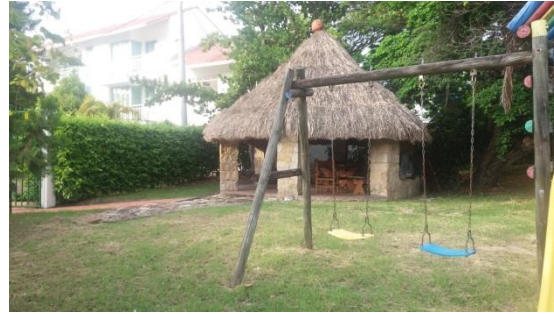
Imagen 2. Entrada al predio del proyecto