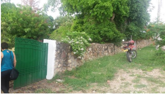
Imagen 1. Vista frontal del lote