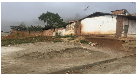
Imagen 1. Vista frontal del lote

Ubicación del Lote: El lote en el cual se desarrollará el proyecto corresponde al predio con matrícula inmobiliaria N° 248-29086 de propiedad del Municipio de SAN LORENZO, con un área aproximada de 257m 2 .