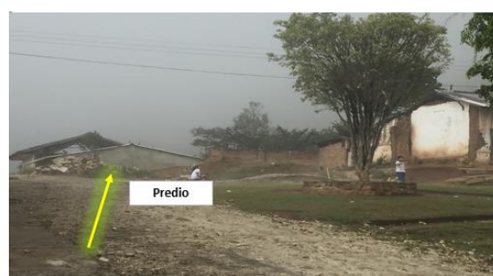
Imagen 2. Entrada al predio del proyecto