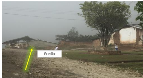
Imagen 2. Entrada al predio del proyecto