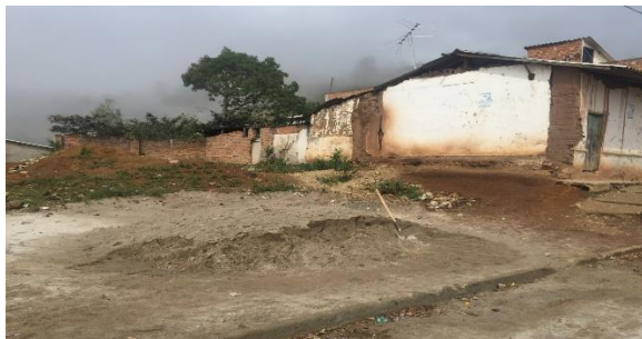
Imagen 1. Vista frontal del lote

Ubicación del Lote: El lote en el cual se desarrollará el proyecto corresponde al predio con matrícula inmobiliaria N° 248-29086 de propiedad del Municipio de SAN LORENZO, con un área aproximada de 257m².