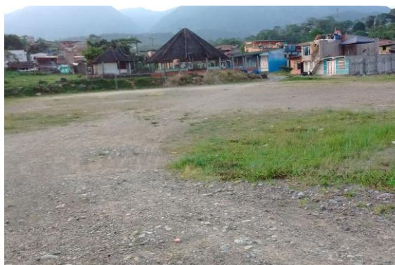
Predio para el CDI de Mocoa