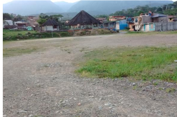
Predio para el CDI de Mocoa