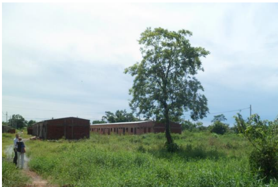
Imagen 1. Entrada al predio del proyecto