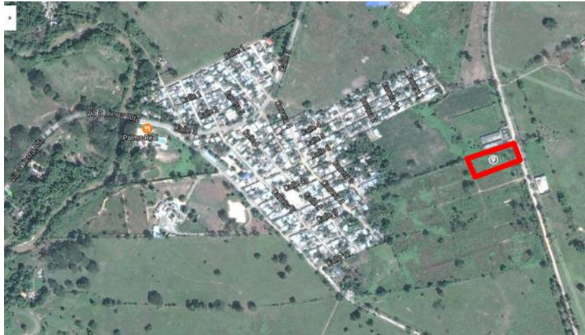
Figura 1. Localización Predio para la construcción del CDI

Ubicación del Lote: El lote en el cual se desarrollará el proyecto corresponde al predio con matrícula inmobiliaria N° 140-90353 de propiedad del Municipio de Tierralta, con un área aproximada de 2.624 m 2 .