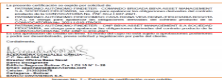
Imagen No. 1 - Excerpto de certificación cupo crédito

RESPUESTA: Una vez revisado el informe de evaluación es de aclarar que la certificación de cupo de crédito allegada con la propuesta, está dirigida al proceso de contratación en referencia PATRIMONIO AUTÓNOMO FINDETER - DNP, BBVA ASSET MANAGEMENT, S.A. (CONSORCIO PRODUCTORA), se otorga para apalancar las obligaciones derivadas del contrato producto de la CONVOCATORIA No. PAF - DNP - C - 010 - 2021 (Imagen 1) por lo tanto, no puede La Entidad manifestar que dicho documento no se encuentra relacionado con la convocatoria a la cual fue presentada la oferta, razón por la cual no se está incurriendo en ninguna causal de rechazo.