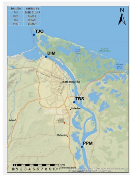
Figura 2. Distribución espacial estaciones permanentes para el registro del nivel de agua

Adicional a lo anterior, las batimetrías de predragado y de postdragado realizadas por el contratista, deben ser realizadas con equipos de medición distintos a los empleados por el interventor.