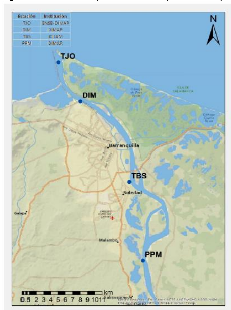
Figura 2. Distribución espacial estaciones permanentes para el registro del nivel de agua

Adicional a lo anterior, las batimetrías de predragado y de postdragado realizadas por el contratista, deben ser realizadas con equipos de medición distintos a los empleados por el interventor.