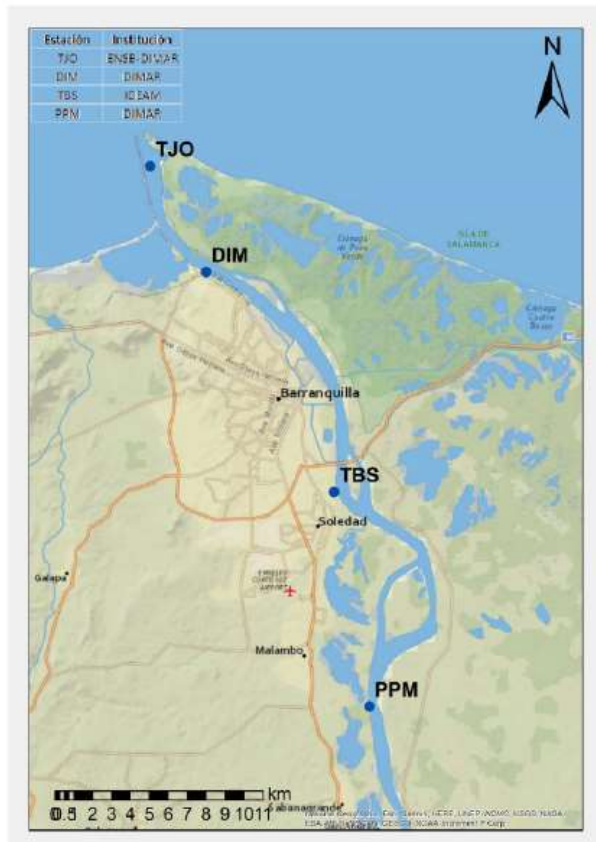
Figura 2. Distribución espacial estaciones permanentes para el registro del nivel de agua

Adicional a lo anterior, las batimetrías de predragado y de postdragado realizadas por el contratista, deben ser realizadas con equipos de medición distintos a los empleados por el interventor.