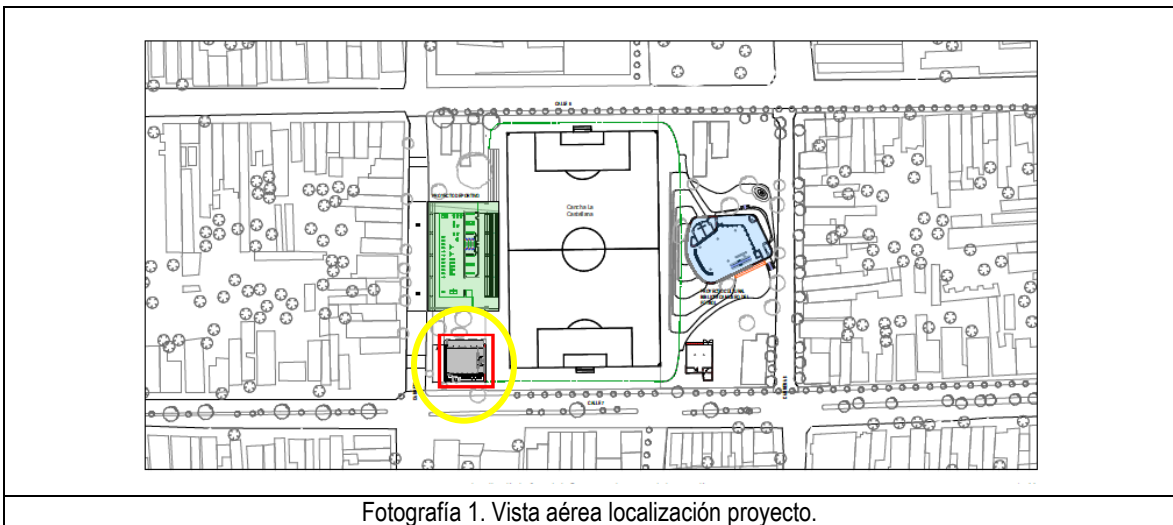
Fotografía 1. Vista aérea localización proyecto.

La ejecución de la infraestructura objeto de la presente convocatoria se llevará a cabo en el lote identificado bajo la Matrícula Inmobiliaria No. 080-137463 propiedad del municipio de Santa Marta.