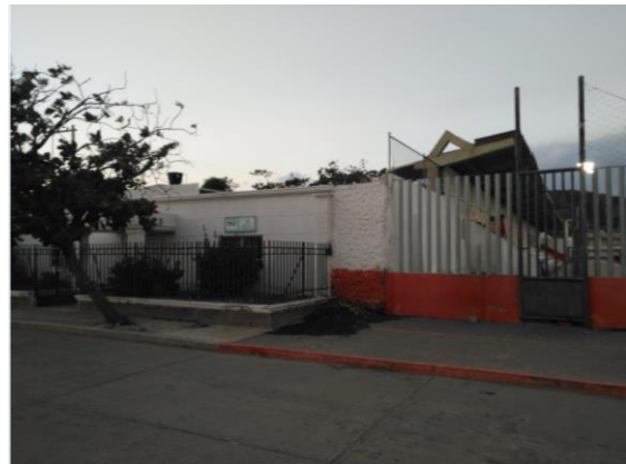
Fotografía 3. Predio donde se ejecutará el proyecto.

Ubicación del Lote: El lote en el cual se desarrollará el proyecto corresponde al predio con matrícula inmobiliaria No. 080-137463 de propiedad de la alcaldía Municipal de Santa Marta.