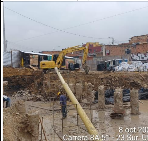
Excavación para conformación del sótano 8/10/2024