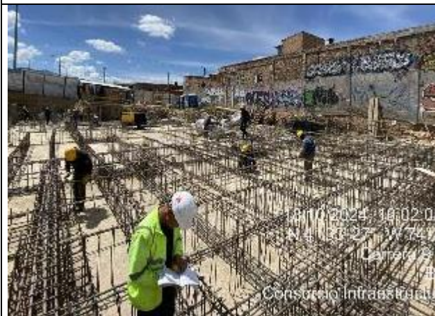
Armado de acero para cimentación 18/10/2024