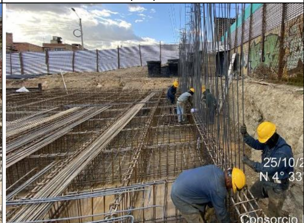
Armado de acero para cimentación 25/10/2024