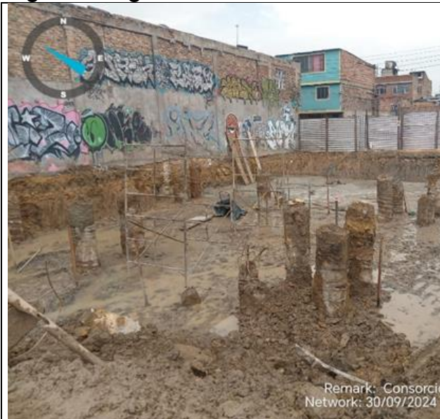
Excavación para conformación del sótano 30/09/2024