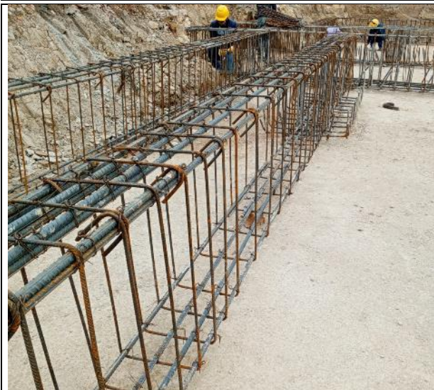
Armado de acero para vigas de cimentación 11/10/2024