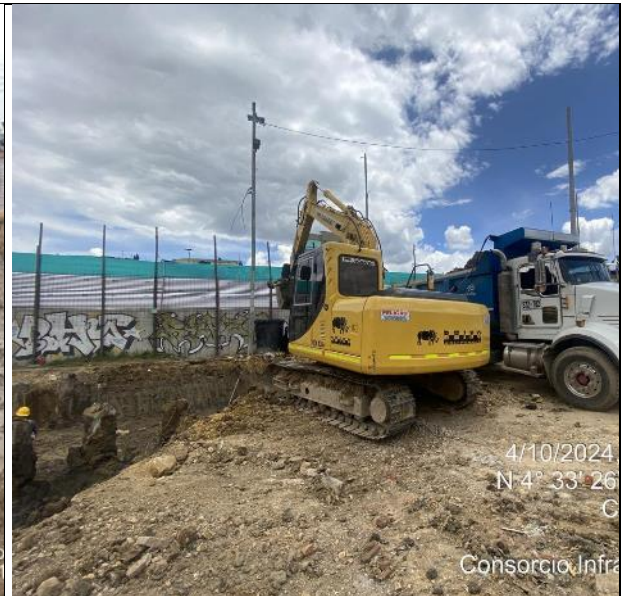
Excavación para conformación del sótano 4/10/2024