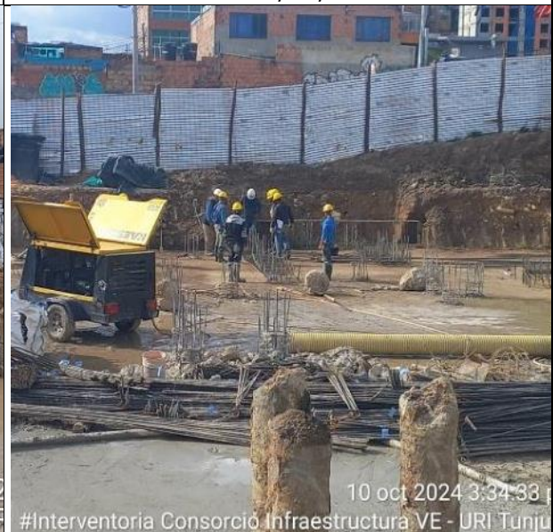
Descabece de pilotes 10/10/2024