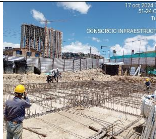
Armado de acero para cimentación 17/10/2024