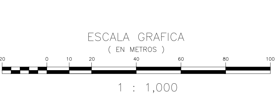
PLANTA GENERAL Escala 1:1000