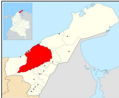
Figura 1 – Localización General Municipio de Riohacha – Guajira

El proyecto se localiza sobre la vía que comunica a Riohacha con Maicao, a una distancia aproximada de 4.3 Km de la zona poblada del casco urbano de Riohacha, en predios del Batallón y SENA Industrial.