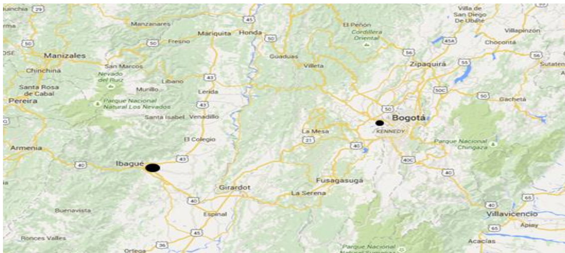
Figura 1. Localización Municipio de Ibagué – Tolima (Fuente Google Maps).

La ejecución del futuro contrato se deberá llevar a cabo en la ciudad de Ibagué capital del departamento del Tolima, localizada a 210 kilómetros al occidente de Bogotá (Capital colombiana), sobre una terraza inclinada, que hace parte de uno de los contrafuertes de la Cordillera Central.